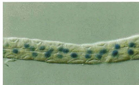
ショウジョウバエの腸管 ( dve 遺伝子の発現)

生体各部の形態形成をつかさどる位置情報が決定されるメカニズムについて、 dve 遺伝子を用いて研究しています。 特にショウジョウバエの翅、脚、触角の形態形成を対象にしています。