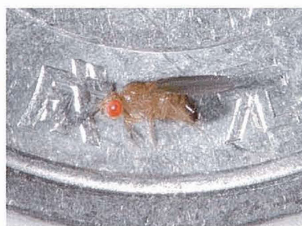
キイロショウジョウバエ

”ものを見分ける”ために必要な遺伝的プログラムはどのように獲得されるのかの解明を進めています。 視覚認識行動に異常をきたしたショウジョウバエ突然変異体の原因遺伝子( dve )を同定しました。この遺伝子によって神経機能が制御される仕組みを、分子レベルで解析しています。