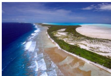
キリバス共和国 タラワ環礁の サンゴ礁と 洲島

今回のサイエンスカフェでは、私がこれまでに行ってきた環礁国（キリバス共和国、ツバル、マーシャル諸島共和国、モルディブ共和国）での現地調査を基にして、これらの国々の自然環境とその成り立ち、災害、そこに住む人々の生活についてお話します。温暖化時代の脆弱性はどこにあるのか、美しいスライドを見ながら人類の課題を一緒に考えてみましょう。