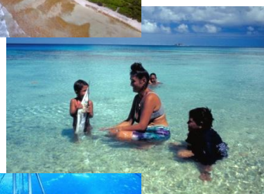
フレンチ ポリネシア の人々