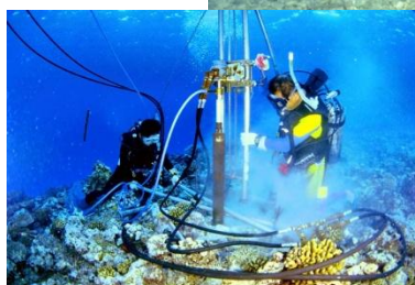
水中ボーリング 調査