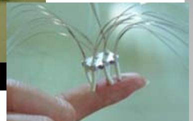
マイクロ多脚歩行ロボット