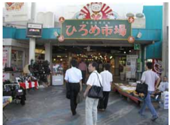
街づくりのための視察 (高知市)

キーワード：不動産、金融工学、地域成長、都市経済、政策評価、地域格差、新産業創出、